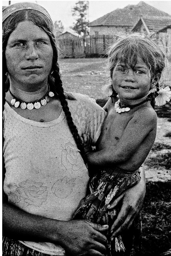
Rumunsko / Romania.1998