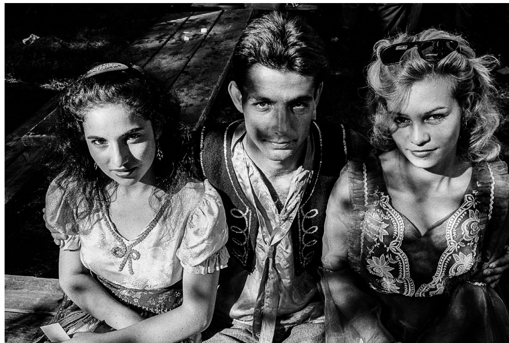
Česko / Czech Republic, 1993

Sú dvaja, jeden muž a jedna žena, dva odlišné pohľady, dva spôsoby, ako hovoriť a milovať, krásne samovoľné prenikanie, akoby osmóza, a preto je často nemožné vedieť, kto urobil tú alebo onú fotografiu. Ich štyri oči sú napokon (dvoj)jedným pohľadom na ľudí, ktorých fotografujú. Vidíte všetky tie usmievavé a občas aj smutné tváre, vždy však krásne, všetky tie rodiny, a akoby ste sa vracali k východiskovému bodu, veď predsa Zem je guľatá, ale nebudete musieť prejsť okolo celého